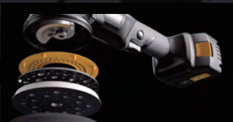
マルチホールパッド