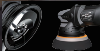
優れた動態バランス