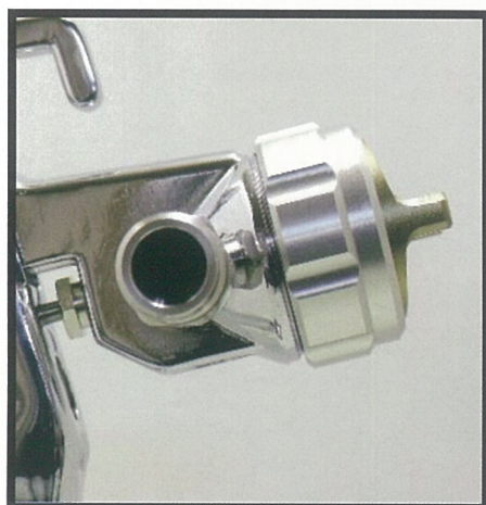
高粘度の塗料に対応する 大口徑ニップル

新開発の B. O. S 機構は、横方向への飛散を抑制することで、塗着効率が上がります。