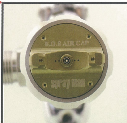
新開発の B. O. S 空気キャップ (Block Over Spraymist) オーバーミストを抑制

高吐出タイプの塗料ノズルとシャストな微粒化が塗着効率を上げ、コート回数を減らします。ゴミ付着等のトラブルの軽減にも貢献します。