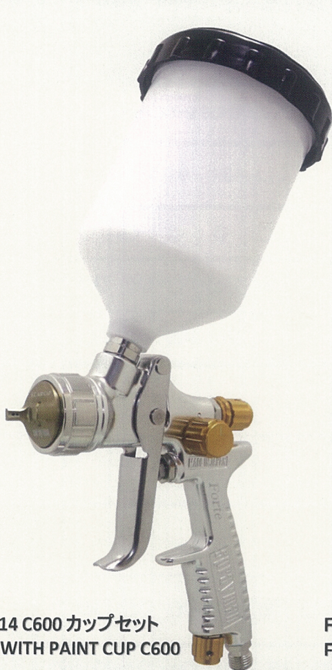
Forte/C-14 C600 カップセット Forte/C-14 WITH PAINT CUP C600