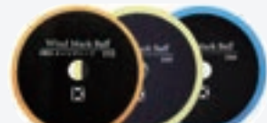
ウインドマークバフ