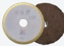
つるぎウールバフ