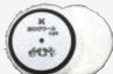
白ひげウールバフ