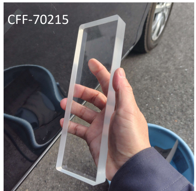
・ サイズ：20mm厚 × 70mm × 215mm