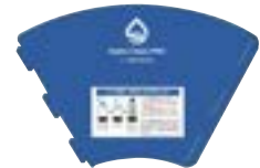
イオン交換樹脂充填用漏斗