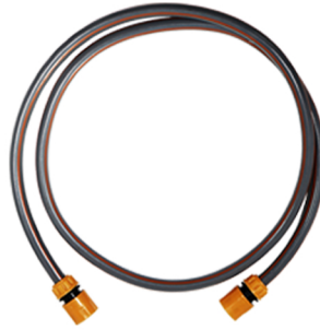
蛇口接続用ホース2m (汎用カブラ)