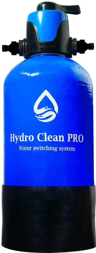
切替バルブ & ストレーナー配管付き FRP製10L高压タンク (10L用タンク)