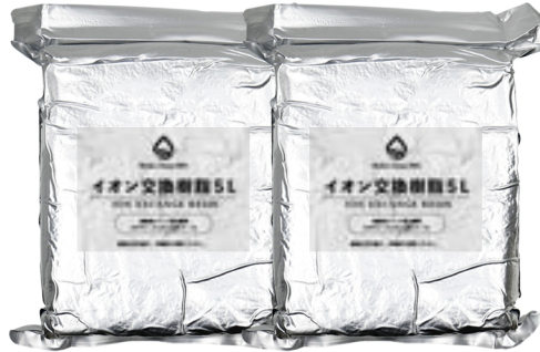
イオン交換樹脂10L (5L×2袋)