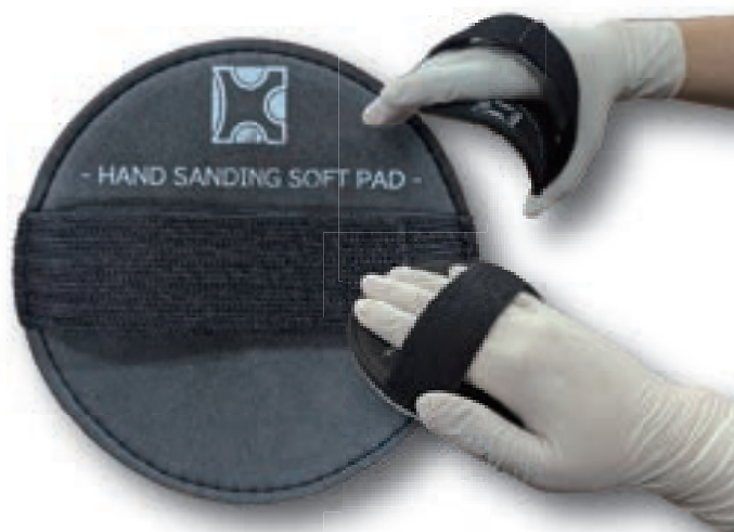
125mm のマジックタイプに対応

厚さ 5mm のパッドでしっかりとした サンディングが行えます 柔軟性のあるパッドのため逆アールにもしっかり追従 マジック式ペーパーを貼り付けるだけで使用可能 また手の固定にはマジックテープで サイズ調整を行えます 折り曲げても石飛びが少ないサンマイトペーパーと 合わせるとより作業効率が上がります